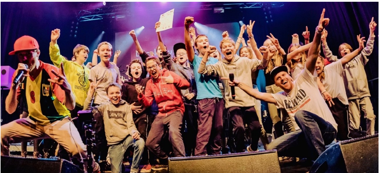
Victoire des élèves du Theodor-Heuss-Gymnasium en janvier 2019.

https://www.youtube.com/watch?v=Lm21vQRInNY