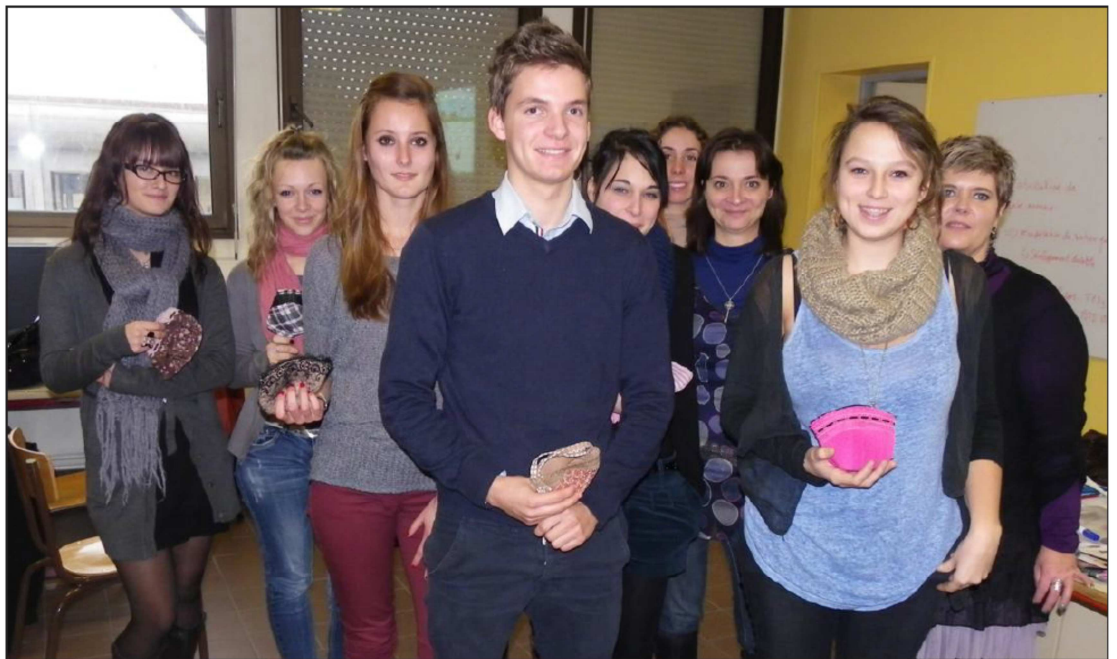
■ L'objectif de la coopérative ? Vendre des produits régionaux en Espagne.

Les commerciaux de la coopérative ont démarché les entreprises (Klaus, Buhler...) pendant les vacances pour obtenir des produits à bas coût ou